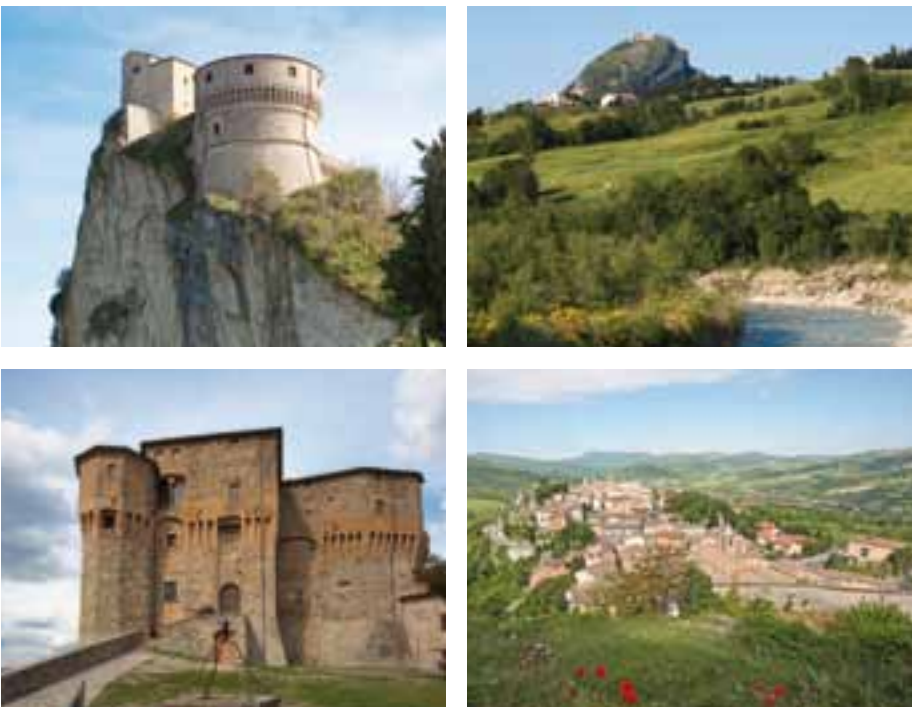
Le Montefeltro de Rimini / En el Montefeltro riminés / В исторической зоне Монтефельтро Риминезе