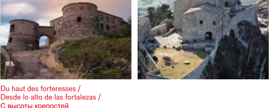
Les châteaux sur les collines / Castillos en las colinas / Замки на холмах