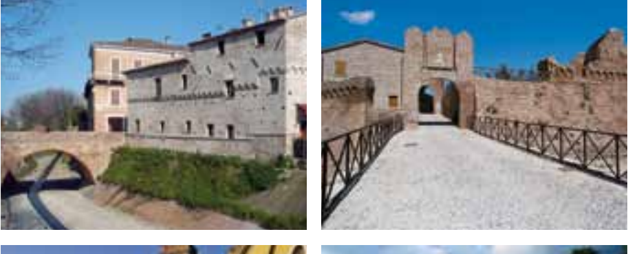
Les châteaux sur les collines / Castillos en las colinas / Замки на холмах