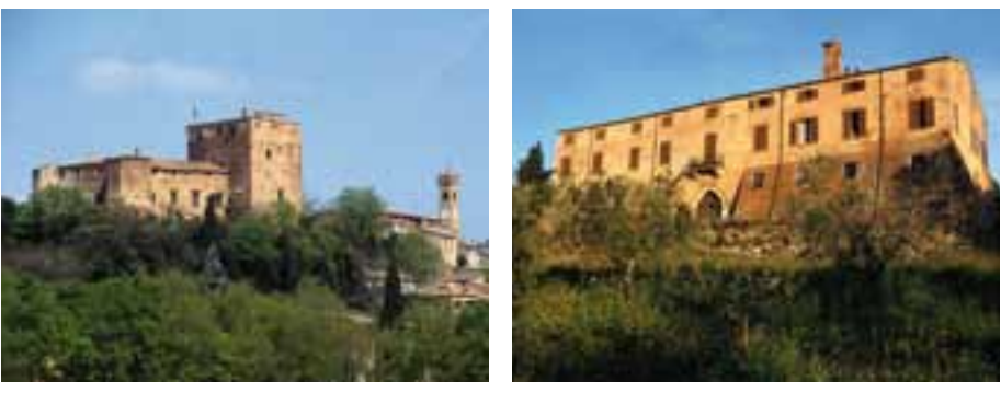
Du haut des forteresses / Desde lo alto de las fortalezas / С высоты крепостей