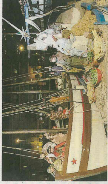
Il suggestivo arrivo dei Magi

Anche l'Epifania può arrivare in ritardo. Le condizioni meteorologiche avverse dello scorso 6 gennaio avevano costretto gli organizzatori, l'Associazione Ponte dei Miracoli a far slittare l'evento. Così, con un ritardo di 4 giorni ma con un clima decisamente migliore, domenica 10 gennaio si è svolta la decima edizione dell'arrivo dei Re Magi in corteo navale, festa organizzata dall'Associazione Ponte dei Miracoli e dalla Parrocchia San Giuseppe al Porto. Con il bellissimo accompagnamento dei giovani del coro SMS (Spes Mariae Sanctissimae). Dall'Associazione Ponte dei Miracoli un grande ringraziamento a chi ha reso possibile la manifestazione: agli oltre 100 volontari, alle associazioni della marineria riminese, alle forze dell'ordine, alla Confartigianato di Rimini.